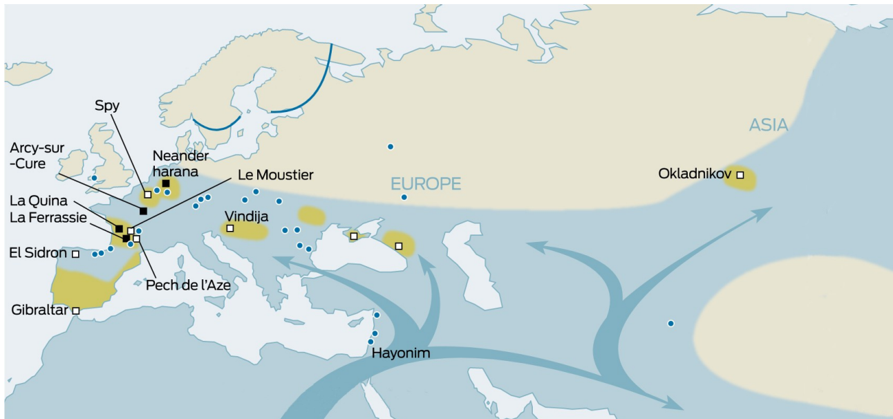
Afbeelding 6:

gemeenschap in het meest oostelijke deel van hun bekende verspreidingsgebied 35 . De sociale structuur van die groep suggereert dus eerder een patriarchale ordening, totaal verschillend van de gender egalitaire structuur van de oorspronkelijke anatomisch moderne mens 36 37 38 39 40 .