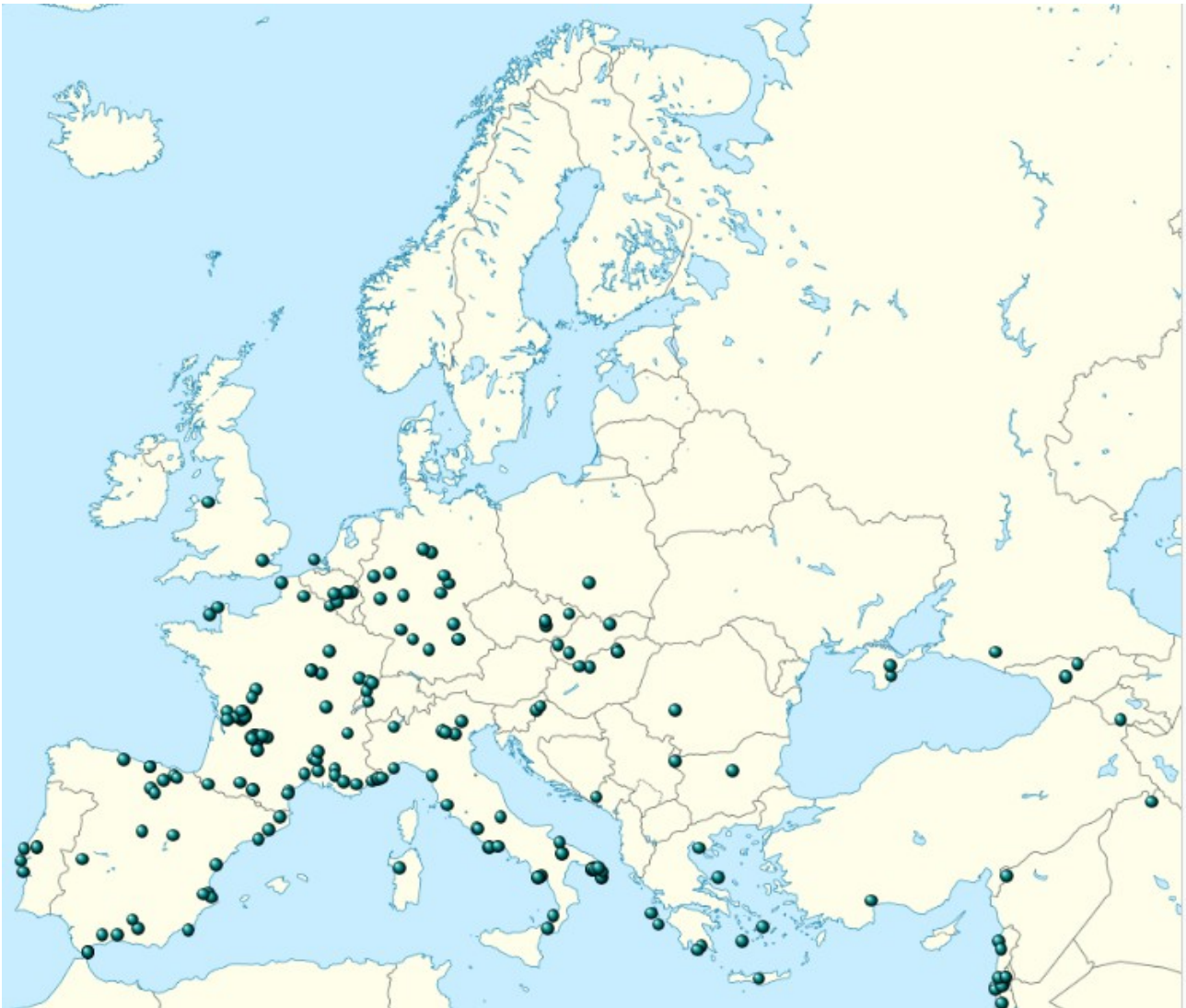
Afbeelding 2: [Kaart vindplaatsen Neanderthaler archeologie (Wikipedia, Locations of Neanderthal finds in Europe and the Levant.)]

Het Pleistoceen kenmerkt zich door een afwisseling van perioden met een gematigd warm klimaat, interglacialen zoals de huidige tijd, en perioden met een overwegend veel kouder klimaat, de zogenaamde glacialen of ijstijden. Tijdens die glacialen kwam de ijskap aan de Noordpool tot in het noorden van Nederland en Duitsland. Aan de rand daarvan was Europa een mammoetsteppe of steppetoendra, een gebied zonder boom- en struiklaag, grenzend aan het poolgebied. Tot de overheersende plantensoorten behoorden grassen, zegge, kruidachtige planten, dwergberk en poolwilg.