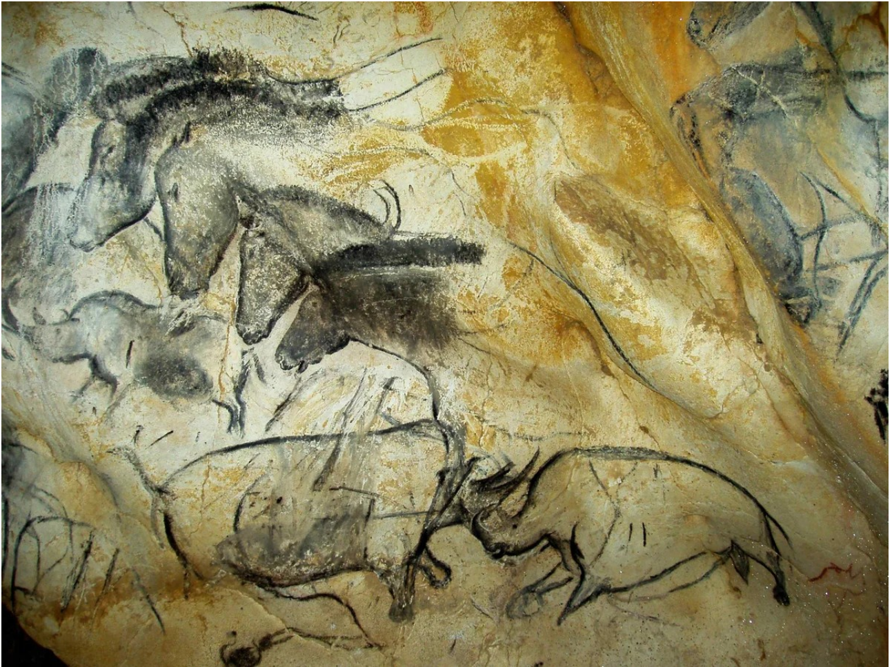
Afbeelding 3: [Neanderthaler Grotschildering (Painting in the Chauvet cave, 32,000-30,000 BC. Fine Art Images/Heritage Images via Getty Images)]