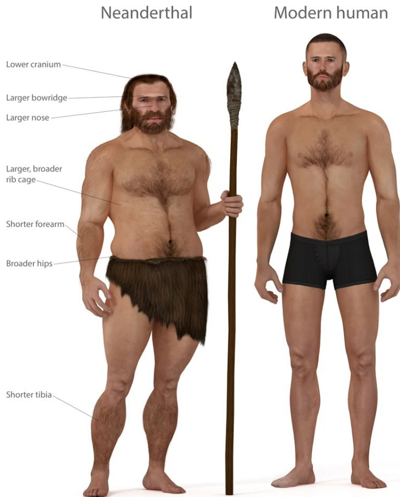
Afbeelding 1: [Foto Neanderthaler versus Homo Sapiens]

De robuuste lichaamsbouw van de Neanderthaler was aangepast aan de barre levensomstandigheden tijdens het Pleistoceen in Eurazië. Daar waren ze beland vanuit Afrika, terwijl de Homo Sapiens in Afrika achterbleef tot ongeveer 70.000 jaar geleden.